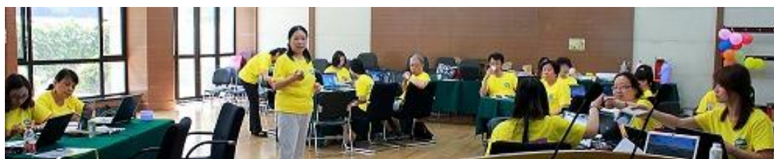
(2014 年中国 AFS 国际理解教育研讨会)

AFS 在从事国际文化交流项目的经验基础上，通过数以万计项目参加者的亲身经历开展国际理解教育/跨文化学习的理论研究，开发系统的国际理解教育课程，以及邀请在国际上享有声誉的专家团队，举办培训和研讨活动，推动 AFS 跨文化交流，增进项目参加者对不同国家、不同文化的认识和理解。