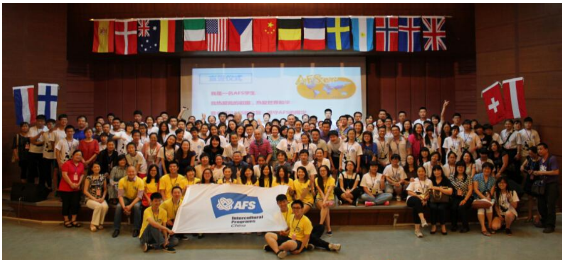
(AFS 项目出国前培训【华北区】)