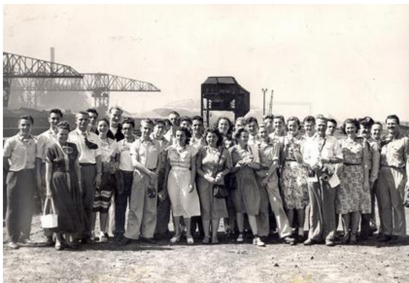
(历史中的 AFS 学子们)

为了实现这一愿景，1947 年，AFS 国际文化交流组织正式成立，总部设在美国纽约，成为以各国中学生、大学生和教师的教育、文化交流为主体的志愿性多边国际组织。在一百年的历史里，AFS 项目以促进全球对话、推动世界和平、培养具有国际视野和跨文化交流能力的未来领袖为宗旨，以住家和学校交流为主要交流方式，以志愿者支持和社区服务为主要特色，在全球拥有 59 个伙伴组织，超过 2,300 个双边国际交流项目，在 110 个国家和地区开展，项目总人数累计近 500,000 人，为当今世界培养了一批批杰出的青年人。2015 年 4 月，AFS 国际文化交流组织获得联合国教科文组织特别咨商地位，成为教科文组织正式合作伙伴。