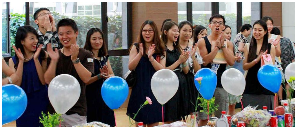
(2014 届 AFS 中国学友会)

充实而富有意义的 AFS 经历让很多项目参加者在结束项目后成功地走向了学业和职业的人生新高度。AFS 中国学友会旨在让项目参加者在完成项目后继续交流和分享自己在 AFS 以及后 AFS 时代中的成长历程和人生经验，互相帮助，走向更有成就的未来。