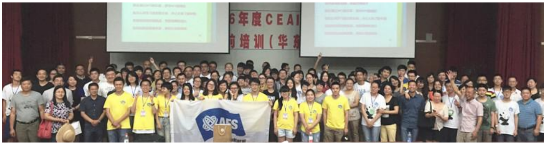
(AFS 项目出国前培训【华东区】)