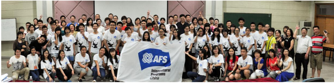
(AFS 项目出国前培训【华南区】)