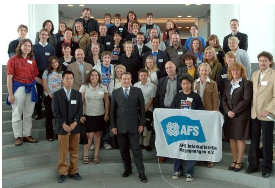
(德国前总理接见来自全球各地的 AFS 学生)

AFS 项目参加者在抵达国外开始 AFS 经历时，并非只和中国参加者及当地人认识，而是与来自世界各国各地区的 AFS 学生交流。这种经历将会贯穿整个 AFS 项目。不同国家地区的 AFS 学生会一起参与各种活动和学习，项目参加者将体验接待国和其他国家地区的文化与风情。AFS 项目的学生是一名一直浸润在国际环境中真正的国际学生。